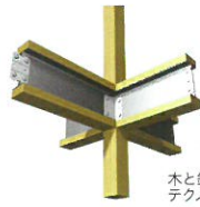
木と鉄を融合したテクノビーム

テクノストラクチャーは、木の強さと鉄の強さをあわせもつ複合「テクノビーム」を使用することで、地震に強く開放的な木の家を実現します。